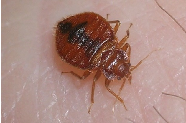
بق فراش ناضج أثناء تناول وجبة الدم.