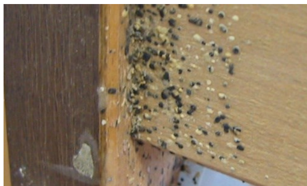
Izmet stjenica na podnici snažno napadnuta kreveta.