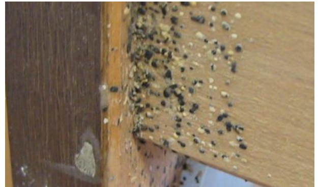
Измет стеница на подлози за душек јако зараженог кревета.