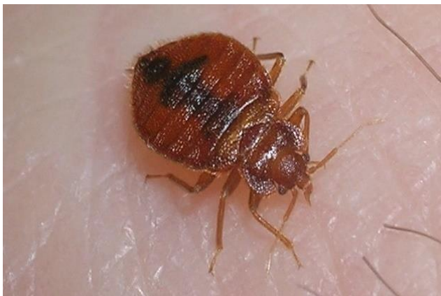
Одрасла креветна стеница приликом сисања крви.