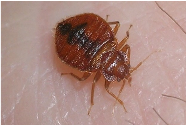
இரத்த உணவை உண்ணும் வயதுவந்த மூட்டைப் பூச்சி.