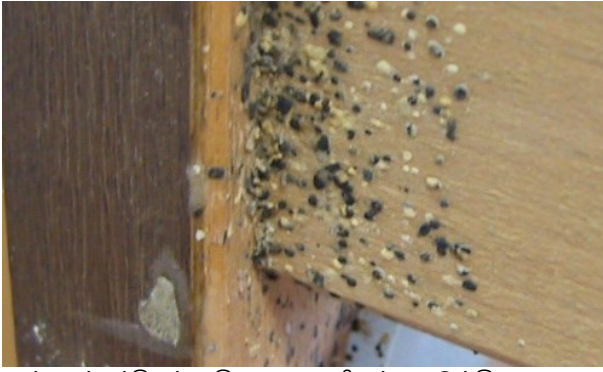
மூட்டைப்பூச்சிகள் அதிகமாக பரவியுள்ள ஒருங்கிய மரக்கட்டை கட்டத்தில் பூச்சி எச்சங்கள்.

மூட்டைப் பூச்சிகள் நிறைந்த அறையில் இரவைக் கழித்த பிறகு என்ன செய்வது?