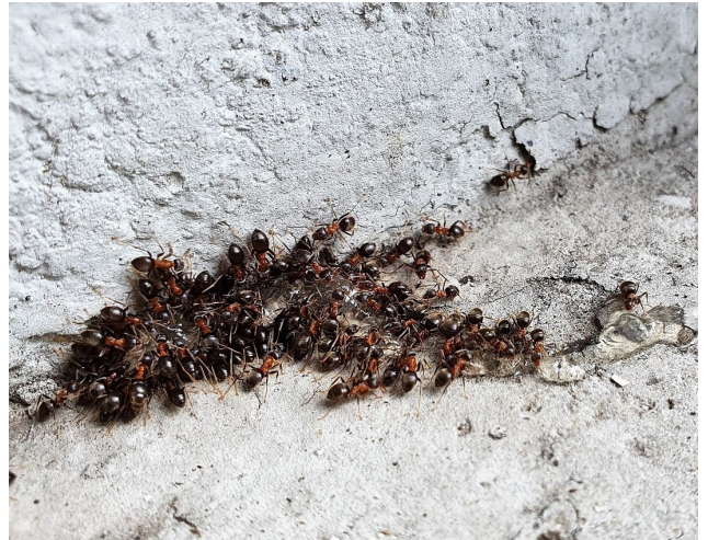
Ansammlung von Arbeiterinnen der Art Lasius brunneus um einen von einer Schädlingsbekämpfungsfirma verwendeten, halbflüssigen Gelköder.

müssen Sie die Köderdosen mindestens ein bis zwei Monate stehen lassen, um auch die aus den Puppen schlüpfenden Ameisen zu erfassen. Bei einem starken Besuch sollten Sie nach zwei bis drei Wochen kontrollieren, ob die Köderdosen noch Köder enthalten und sie falls nötig ersetzen. Eine Ameisenbekämpfung braucht viel Geduld: Eine Wirkung ist frühestens nach drei Wochen zu erwarten, die Tilgung eines ganzen Volkes kann Monate bis Jahre dauern.